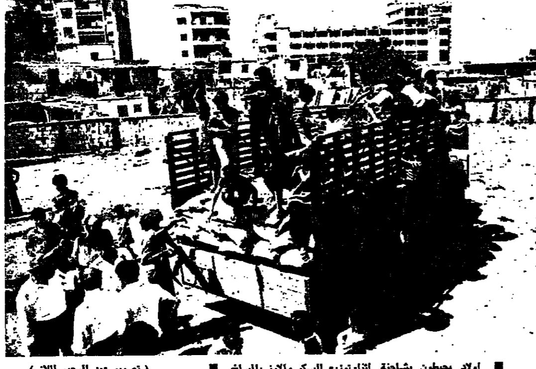
اولاد يعيطرون بشاشة اثناء توزيع السكر والرز بالمسبخ